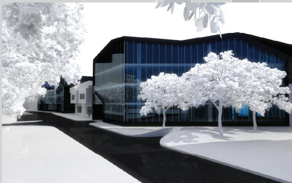
PRIKAZ IZ SABIRNE ULICE